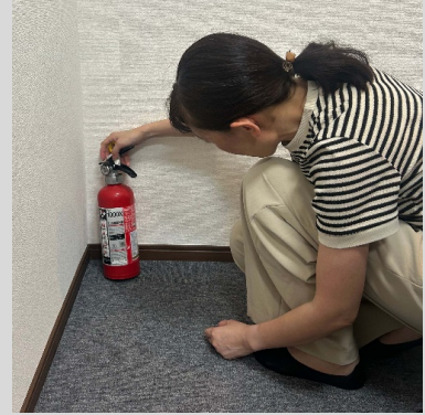
火災時使用機器の検査