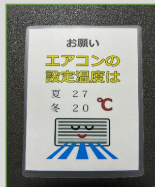
エアコン温度の設定 (冷房：27℃、暖房：20℃)