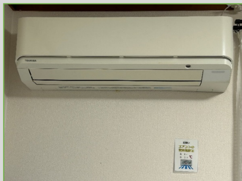
エアコン温度の設定