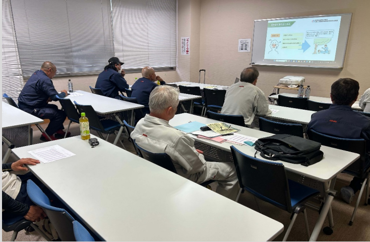
熱中症予防対策の周知