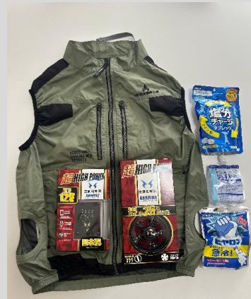
ファン付き作業着