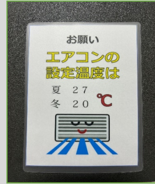
エアコン温度の設定 (冷房：27℃、暖房：20℃)