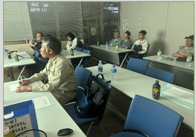
環境経営方針、環境経営目標、環境経営計画、実施体制を全員に周知