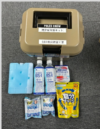
熱中症予防対策キット