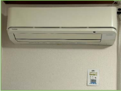
エアコン温度の設定