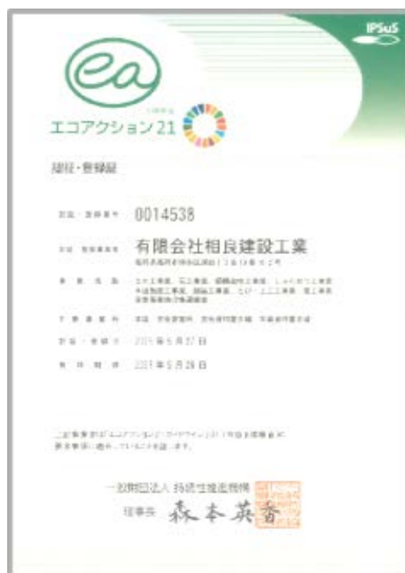
エコアクション21認証・登録証

土木工事業、石工事業、鋼構造物工事業、しゅんせつ工事業、 水道施設工事業、舗装工事業、とび・土工工事業、管工事業、 産業廃棄物収集運搬業