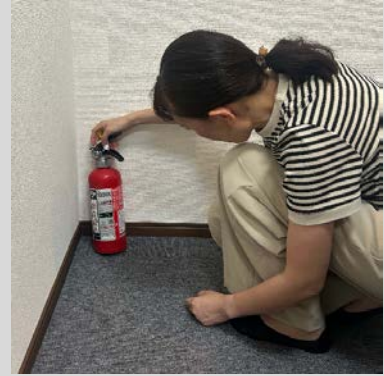
火災時使用機器の検査