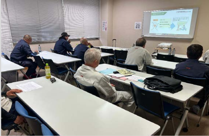
熱中症予防対策の周知